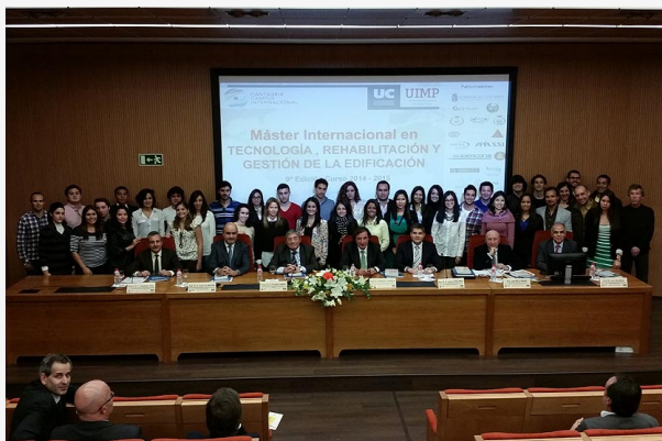
Autoridades y alumnos en la inauguración del máster de Tecnología y Gestión de la Edificación.

El consejero de Obras Públicas y Vivienda inaugura la novena edición del máster de Tecnología y Gestión de la Edificación que por primera vez se lleva a cabo conjuntamente entre la UC y la UIMP